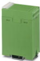
Крышка корпуса, для двустороннего подключения

Обратите внимание на то, что приведенные здесь данные взяты из online-каталога. Полная информация и данные содержатся в документации пользователя. Действуют Общие условия использования для информации, загруженной из интернета. ( http://phoenixcontact.ru/download )