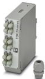
Кабельная коробка для монтажной рейки, без шлейфов, для 6 ST-Duplex

Обратите внимание на то, что приведенные здесь данные взяты из online-каталога. Полная информация и данные содержатся в документации пользователя. Действуют Общие условия использования для информации, загруженной из интернета. ( http://phoenixcontact.ru/download )