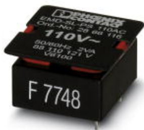
Питающий модуль, вставной, для EMD-SL-..., напряжение питания: 88...121 В AC

Обратите внимание на то, что приведенные здесь данные взяты из online-каталога. Полная информация и данные содержатся в документации пользователя. Действуют Общие условия использования для информации, загруженной из интернета. ( http://phoenixcontact.ru/download )