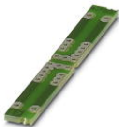
Печатная плата, для монтажа электронных элементов

Обратите внимание на то, что приведенные здесь данные взяты из online-каталога. Полная информация и данные содержатся в документации пользователя. Действуют Общие условия использования для информации, загруженной из интернета. ( http://phoenixcontact.ru/download )