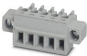
На рисунке показан 5-контактный вариант изделия серого цвета

Разъемы для печатной платы, номинальный ток: 8 А, расчетное напряжение (III/2): 160 В, полюсов: 11, размер шага: 3,81 мм, тип подключения: Винтовой зажим с натяжной гильзой, цвет: черный, поверхность контакта: олово