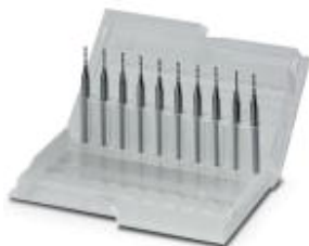
Твердосплавные фрезы, 2 режущие кромки, ширина фрезы: 1,0 мм

Обратите внимание на то, что приведенные здесь данные взяты из online-каталога. Полная информация и данные содержатся в документации пользователя. Действуют Общие условия использования для информации, загруженной из интернета. ( http://phoenixcontact.ru/download )