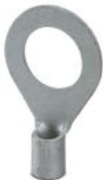
Кольцевой кабельный наконечник, неизолирован., 10 мм 2 , M12

Обратите внимание на то, что приведенные здесь данные взяты из online-каталога. Полная информация и данные содержатся в документации пользователя. Действуют Общие условия использования для информации, загруженной из интернета. ( http://phoenixcontact.ru/download )