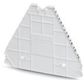
Концевая крышка, длина: 100 мм, ширина: 2,2 мм, высота: 80,8 мм, цвет: белый

Обратите внимание на то, что приведенные здесь данные взяты из online-каталога. Полная информация и данные содержатся в документации пользователя. Действуют Общие условия использования для информации, загруженной из интернета. ( http://phoenixcontact.ru/download )