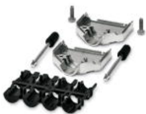
Корпус кабельного разъема POWER-SUBCON, количество полюсов 5

Обратите внимание на то, что приведенные здесь данные взяты из online-каталога. Полная информация и данные содержатся в документации пользователя. Действуют Общие условия использования для информации, загруженной из интернета. ( http://phoenixcontact.ru/download )