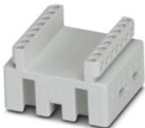
Боковое расширение удлинителя высоты для адаптера устройства Comfort, ширина: 45 мм

Обратите внимание на то, что приведенные здесь данные взяты из online-каталога. Полная информация и данные содержатся в документации пользователя. Действуют Общие условия использования для информации, загруженной из интернета. ( http://phoenixcontact.ru/download )