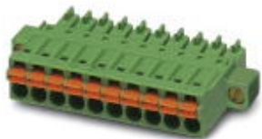
На рисунке показан 10-контактный вариант изделия

Разъемы для печатной платы, номинальный ток: 8 А, расчетное напряжение (III/2): 160 В, полюсов: 7, размер шага: 3,81 мм, тип подключения: Пружинные зажимы Push-in, цвет: зеленый, поверхность контакта: олово