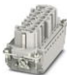
Гнездовая вставка HEAVYCON, серия V16, 16 контактов + PE, разъем Push-in

Модуль для контактов - HC-B16-I-PT-F - 1407731