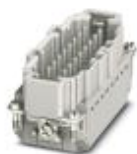
Штыревая вставка HEAVYCON, серия V16, 16 контактов + PE, разъем Push-in

Модуль для контактов - HC-B16-I-PT-M - 1407732