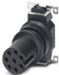
Встраиваемые разъемы, 8-полюсн., Гнездо, прямое, M8, A-кодирование, Монтаж на печатную плату, SMD

Обратите внимание на то, что приведенные здесь данные взяты из online-каталога. Полная информация и данные содержатся в документации пользователя. Действуют Общие условия использования для информации, загруженной из интернета. ( http://phoenixcontact.ru/download )