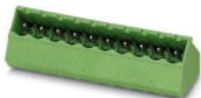
На рисунке показан 10-контактный вариант изделия

Корпусная часть для печатных плат, номинальный ток: 12 А, расчетное напряжение (III/2): 320 В, полюсов: 16, размер шага: 5,08 мм, цвет: зеленый, поверхность контакта: олово, монтаж: Пайка волной припоя