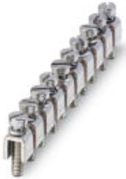
Винтовая перемычка, размер шага: 10 мм, полюсов: 10, цвет: серебристый

Обратите внимание на то, что приведенные здесь данные взяты из online-каталога. Полная информация и данные содержатся в документации пользователя. Действуют Общие условия использования для информации, загруженной из интернета. ( http://phoenixcontact.ru/download )