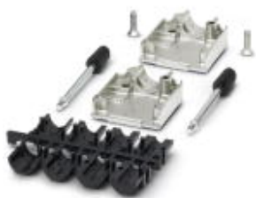
Корпус кабельного разъема POWER-SUBCON, количество полюсов 3

Обратите внимание на то, что приведенные здесь данные взяты из online-каталога. Полная информация и данные содержатся в документации пользователя. Действуют Общие условия использования для информации, загруженной из интернета. ( http://phoenixcontact.ru/download )