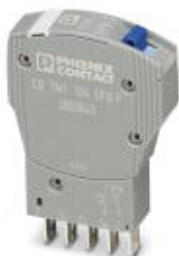
Термомагнитный защитный выключатель, 1-полюсный, характеристика срабатывания SFB, 1 переключающий контакт, штекер для базового элемента.

Обратите внимание на то, что приведенные здесь данные взяты из online-каталога. Полная информация и данные содержатся в документации пользователя. Действуют Общие условия использования для информации, загруженной из интернета. ( http://phoenixcontact.ru/download )