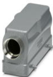
Сальниковый корпус HEAVYCON B24, для крепления двумя защелками, высота 65 мм, с патрубком 1х Pg21, боковое подсоединение кабеля

Обратите внимание на то, что приведенные здесь данные взяты из online-каталога. Полная информация и данные содержатся в документации пользователя. Действуют Общие условия использования для информации, загруженной из интернета. ( http://phoenixcontact.ru/download )