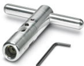
Специальный инструмент для точной установки разъема на излучающий кабель

Обратите внимание на то, что приведенные здесь данные взяты из online-каталога. Полная информация и данные содержатся в документации пользователя. Действуют Общие условия использования для информации, загруженной из интернета. ( http://phoenixcontact.ru/download )