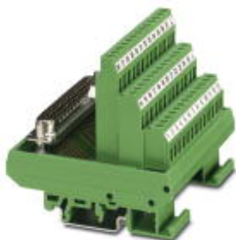
На рисунке показана модель FLKMS-D37 SUB/S (1-37)

Обратите внимание на то, что приведенные здесь данные взяты из online-каталога. Полная информация и данные содержатся в документации пользователя. Действуют Общие условия использования для информации, загруженной из интернета. ( http://phoenixcontact.ru/download )