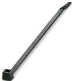
Кабельная стяжка, стандартная версия, для быстрого и надежного соединения

Обратите внимание на то, что приведенные здесь данные взяты из online-каталога. Полная информация и данные содержатся в документации пользователя. Действуют Общие условия использования для информации, загруженной из интернета. ( http://phoenixcontact.ru/download )