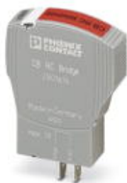
Вставная перемычка для шунтирования контактов с 11 на 14 для базовых элементов CB

Обратите внимание на то, что приведенные здесь данные взяты из online-каталога. Полная информация и данные содержатся в документации пользователя. Действуют Общие условия использования для информации, загруженной из интернета. ( http://phoenixcontact.ru/download )