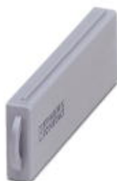
Защитная крышка VARIOCON для монтажной рамы, степень защиты IP40, исполнение 3

Обратите внимание на то, что приведенные здесь данные взяты из online-каталога. Полная информация и данные содержатся в документации пользователя. Действуют Общие условия использования для информации, загруженной из интернета. ( http://phoenixcontact.ru/download )