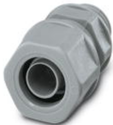
Резьбовое соединение кабеля из полипропилена с резьбой Pg, класс защиты IP65

Обратите внимание на то, что приведенные здесь данные взяты из online-каталога. Полная информация и данные содержатся в документации пользователя. Действуют Общие условия использования для информации, загруженной из интернета. ( http://phoenixcontact.ru/download )