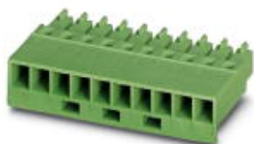
На рисунке показан 10-контактный вариант изделия

Обратите внимание на то, что приведенные здесь данные взяты из online-каталога. Полная информация и данные содержатся в документации пользователя. Действуют Общие условия использования для информации, загруженной из интернета. ( http://phoenixcontact.ru/download )