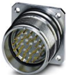
Аппаратн. соединитель, задняя стенка, прямой, M27, тип контактов: Штифт, Выводы под пайку, Плоское уплотнение, 4x Ø 3,2

Обратите внимание на то, что приведенные здесь данные взяты из online-каталога. Полная информация и данные содержатся в документации пользователя. Действуют Общие условия использования для информации, загруженной из интернета. ( http://phoenixcontact.ru/download )