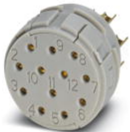
Модуль для контактов, полюсов: 16+3, тип контактов: Розетка, Подключение пайкой

Обратите внимание на то, что приведенные здесь данные взяты из online-каталога. Полная информация и данные содержатся в документации пользователя. Действуют Общие условия использования для информации, загруженной из интернета. ( http://phoenixcontact.ru/download )