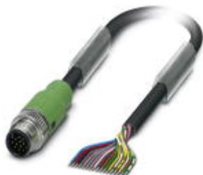
Кабель для датчика / исполнительного элемента, 17-полюсн., ПВХ, черный RAL 9005, Штекеры прямое M12 SPEEDCON, А-кодирование, к свободный конец, длина кабеля: 3 м

Обратите внимание на то, что приведенные здесь данные взяты из online-каталога. Полная информация и данные содержатся в документации пользователя. Действуют Общие условия использования для информации, загруженной из интернета. ( http://phoenixcontact.ru/download )