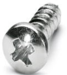
Набор винтов для соединителей DFK-PC 16...

Обратите внимание на то, что приведенные здесь данные взяты из online-каталога. Полная информация и данные содержатся в документации пользователя. Действуют Общие условия использования для информации, загруженной из интернета. ( http://phoenixcontact.ru/download )