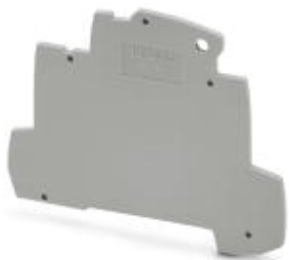
Конечная крышка для замыкания ряда клемм TERMITRAB complete TTC-6...

Обратите внимание на то, что приведенные здесь данные взяты из online-каталога. Полная информация и данные содержатся в документации пользователя. Действуют Общие условия использования для информации, загруженной из интернета. ( http://phoenixcontact.ru/download )