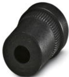
Резиновое уплотнение для резьбового крепежного элемента Pg13,5, для проводников диаметром 6,5 мм ... 9,5 мм

Обратите внимание на то, что приведенные здесь данные взяты из online-каталога. Полная информация и данные содержатся в документации пользователя. Действуют Общие условия использования для информации, загруженной из интернета. ( http://phoenixcontact.ru/download )