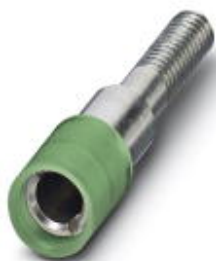
Гнездо для щупа тестера, цвет: зеленый

Обратите внимание на то, что приведенные здесь данные взяты из online-каталога. Полная информация и данные содержатся в документации пользователя. Действуют Общие условия использования для информации, загруженной из интернета. ( http://phoenixcontact.ru/download )