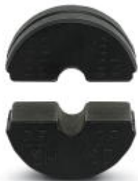
Круглые матрицы (пара), для инструмента CRIMPFOX-C50, для секторного кабеля, 25 + 35 мм 2

Обратите внимание на то, что приведенные здесь данные взяты из online-каталога. Полная информация и данные содержатся в документации пользователя. Действуют Общие условия использования для информации, загруженной из интернета. ( http://phoenixcontact.ru/download )