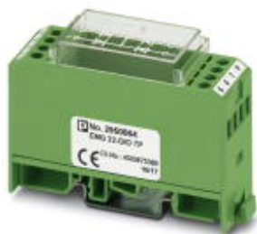
Диодный модуль, с общим катодом, 7 диодов типа 1N 4007

Обратите внимание на то, что приведенные здесь данные взяты из online-каталога. Полная информация и данные содержатся в документации пользователя. Действуют Общие условия использования для информации, загруженной из интернета. ( http://phoenixcontact.ru/download )