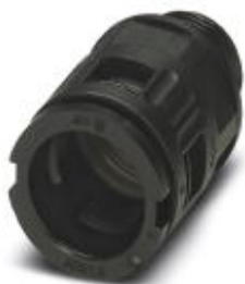
Резьбовое соединение кабеля, метрическая резьба, класс защиты IP68/69k, прямое

Обратите внимание на то, что приведенные здесь данные взяты из online-каталога. Полная информация и данные содержатся в документации пользователя. Действуют Общие условия использования для информации, загруженной из интернета. ( http://phoenixcontact.ru/download )