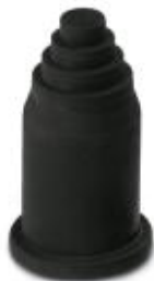
Наконечники, переходные насадки, от рукава к кабелю

Обратите внимание на то, что приведенные здесь данные взяты из online-каталога. Полная информация и данные содержатся в документации пользователя. Действуют Общие условия использования для информации, загруженной из интернета. ( http://phoenixcontact.ru/download )