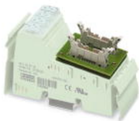
Фронтальный адаптер VARIOFACE для узлов Inline, передача 16 (2 x 8) цифровых входных сигналов.

Обратите внимание на то, что приведенные здесь данные взяты из online-каталога. Полная информация и данные содержатся в документации пользователя. Действуют Общие условия использования для информации, загруженной из интернета. ( http://phoenixcontact.ru/download )