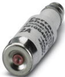
Плавкая вставка, номинальный ток: 2 А, длина: 36 мм, диаметр: 11 мм, цвет: розовый

Обратите внимание на то, что приведенные здесь данные взяты из online-каталога. Полная информация и данные содержатся в документации пользователя. Действуют Общие условия использования для информации, загруженной из интернета. ( http://phoenixcontact.ru/download )