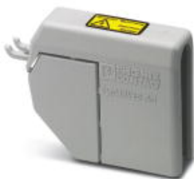
Крышка, ширина: 22,8 мм, высота: 53,2 мм, цвет: серый

Обратите внимание на то, что приведенные здесь данные взяты из online-каталога. Полная информация и данные содержатся в документации пользователя. Действуют Общие условия использования для информации, загруженной из интернета. ( http://phoenixcontact.ru/download )