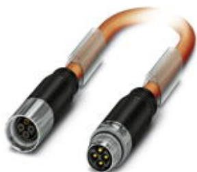
Штекерный разъем, пластиковая заливка с обеих сторон, длина: 2 м, цвет наружной оболочки: оранжевый RAL 2003

Обратите внимание на то, что приведенные здесь данные взяты из online-каталога. Полная информация и данные содержатся в документации пользователя. Действуют Общие условия использования для информации, загруженной из интернета. ( http://phoenixcontact.ru/download )