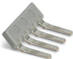
Гребенчатые мостики для штекеров с винтовыми зажимами с шагом 3,81 мм

Обратите внимание на то, что приведенные здесь данные взяты из online-каталога. Полная информация и данные содержатся в документации пользователя. Действуют Общие условия использования для информации, загруженной из интернета. ( http://phoenixcontact.ru/download )