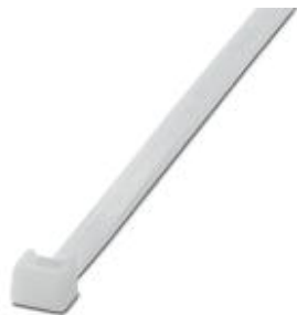
Кабельная стяжка, стандартная версия, для быстрого и надежного соединения

Обратите внимание на то, что приведенные здесь данные взяты из online-каталога. Полная информация и данные содержатся в документации пользователя. Действуют Общие условия использования для информации, загруженной из интернета. ( http://phoenixcontact.ru/download )