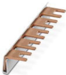
Монтажные перемычки для модуля с соединительным шагом 17,5 мм, 1-фазные, 5-полюсные

Обратите внимание на то, что приведенные здесь данные взяты из online-каталога. Полная информация и данные содержатся в документации пользователя. Действуют Общие условия использования для информации, загруженной из интернета. ( http://phoenixcontact.ru/download )