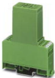
Выпрямительный модуль, с варисторной защитной схемой, рабочее напряжение 230 В AC

Обратите внимание на то, что приведенные здесь данные взяты из online-каталога. Полная информация и данные содержатся в документации пользователя. Действуют Общие условия использования для информации, загруженной из интернета. ( http://phoenixcontact.ru/download )