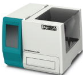
Термопечатающий принтер для материалов в виде карточек

Обратите внимание на то, что приведенные здесь данные взяты из online-каталога. Полная информация и данные содержатся в документации пользователя. Действуют Общие условия использования для информации, загруженной из интернета. ( http://phoenixcontact.ru/download )