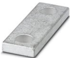
Соединительная шина, полюсов: 2, цвет: серебристый

Обратите внимание на то, что приведенные здесь данные взяты из online-каталога. Полная информация и данные содержатся в документации пользователя. Действуют Общие условия использования для информации, загруженной из интернета. ( http://phoenixcontact.ru/download )