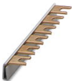
Монтажные перемычки для модуля с соединительным шагом 17,5 мм, 1-фазные, 6-полюсные

Обратите внимание на то, что приведенные здесь данные взяты из online-каталога. Полная информация и данные содержатся в документации пользователя. Действуют Общие условия использования для информации, загруженной из интернета. ( http://phoenixcontact.ru/download )