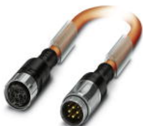
Штекерный разъем, пластиковая заливка с обеих сторон, длина: 2 м, цвет наружной оболочки: оранжевый RAL 2003

Обратите внимание на то, что приведенные здесь данные взяты из online-каталога. Полная информация и данные содержатся в документации пользователя. Действуют Общие условия использования для информации, загруженной из интернета. ( http://phoenixcontact.ru/download )