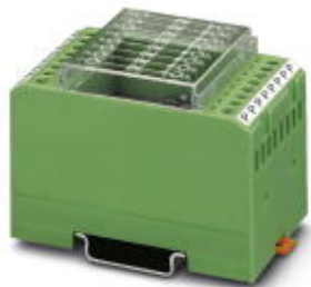
Диодный модуль, 8 диодов, с общим катодом, тип диодов 1N 5408

Обратите внимание на то, что приведенные здесь данные взяты из online-каталога. Полная информация и данные содержатся в документации пользователя. Действуют Общие условия использования для информации, загруженной из интернета. ( http://phoenixcontact.ru/download )