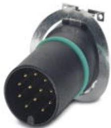
Комплект образцов, 12-полюсн., Штекеры, прямое, M12, A - стандарт, Монтаж на печатную плату, SMD

Обратите внимание на то, что приведенные здесь данные взяты из online-каталога. Полная информация и данные содержатся в документации пользователя. Действуют Общие условия использования для информации, загруженной из интернета. ( http://phoenixcontact.ru/download )